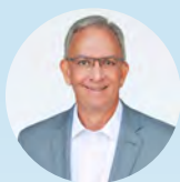
Obispo Tim Coalter