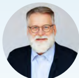
Obispo Clayton Endecott